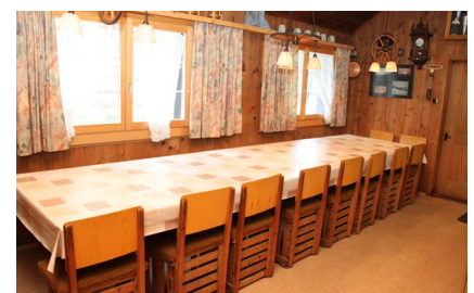
Küchenraum, Platz für 16 Personen