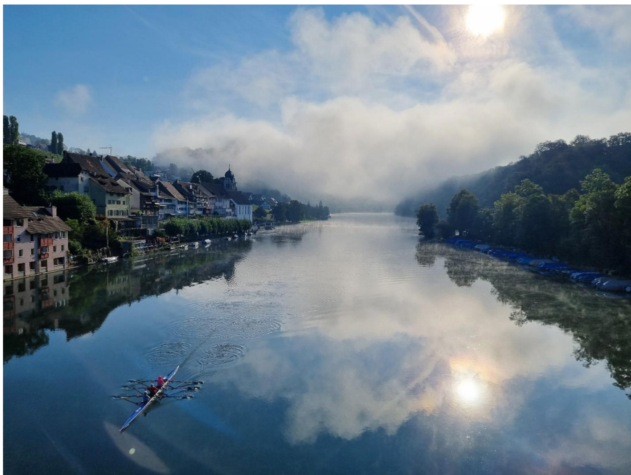
Wanda Pfeifer, 3. Platz Fotowettbewerb 2022