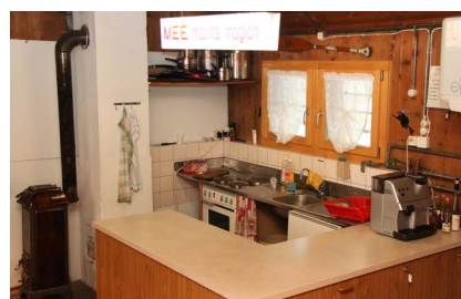
Küche mit Herd, Boiler, Geschirr