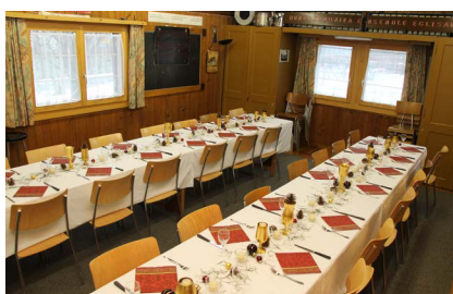
Proberaum, Platz für 32 Personen